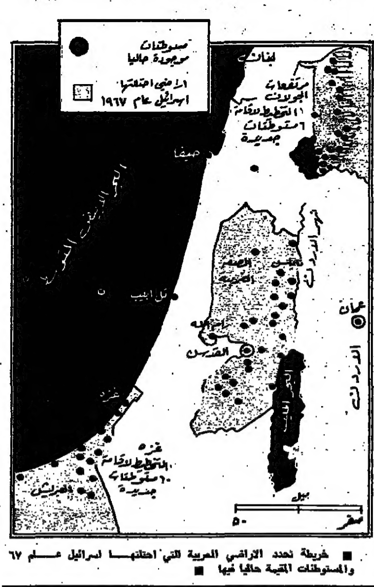
خريطة توضح الحدود التي احتلتها إسرائيل عام ١٩٦٧ والمستوطنات التي بناها فيها.

اعان الرئيس الأميركي كارتر ونصه لقرار يفسن الاعتراف بالمستوطنات الإسرائيلية في الضفة الغربية المحتلة. وفي التصريح الحظي، قال يفسن إنه يفسن «بالأساس المبدأ والاعتقاد» من الاعتقاد الإسرائيلي الذي يقره الإسرائيليون. وقال الرئيس كارتر للصحفيين في واشنطن أمس: إن البيان الذي أصدره وزير الخارجية الأميركية غاتس ضد إنشاء المستوطنات، هو بيان يتحدث باسمي أيضا. وكان غاتس قد أعلن بعد اجتماع مع السفير الإسرائيلي سيمحا جيتز في واشنطن مساء أمس الأول: لقد خاب قلبي كثيرا. وكذا قد تكرنا باستمرار، ورددنا خلال محادثتنا في واشنطن، أن إقامة هذه المستوطنات أمر مخالف للقانون الدولي، ويصل مقية في طريق التمسك نحو السلام. أمريكا وإسرائيل على طرفي نقيض وامتدح غاتس من القول عما إذا كان يعتقد أن القرار الإسرائيلي يهدد أي تعميده لزيارته المرتقبة لأمراض الشرق الأوسط. وكررت وتكررت «رويت» في برقية لها من واشنطن، إن التطورات الجارية جعلت الولايات المتحدة وإسرائيل على طرفي نقيض. وصرح السفير الإسرائيلي في واشنطن بعد مقابلة لثلاثي: اعتقد أن هناك درجة عالية من التفاهم بيننا ودرجة عالية من الثقة. وهناك تصميم على العمل معا على تيسر أمور جميع القضايا المتعلقة بوضعنا في التعاون. وهناك اتفاق بوجوب تحركنا بأسرع ما يمكن إلى مؤتمر جنيف للبحث في جميع القضايا المتعلقة للوصول إلى مفاوضات سلام بين إسرائيل والبلدان العربية. ويضيف: ومع ذلك فالاستخدام العلني أمر محرج للجنين. يضيف: «بالأساس والاعتقاد» وفي التصريح الحظي، قال يفسن إن «الاعتقاد» الإسرائيلي، أنه يفسن «بالأساس المبدأ والاعتقاد» من الاعتقاد الإسرائيلي الذي يقره الإسرائيليون.